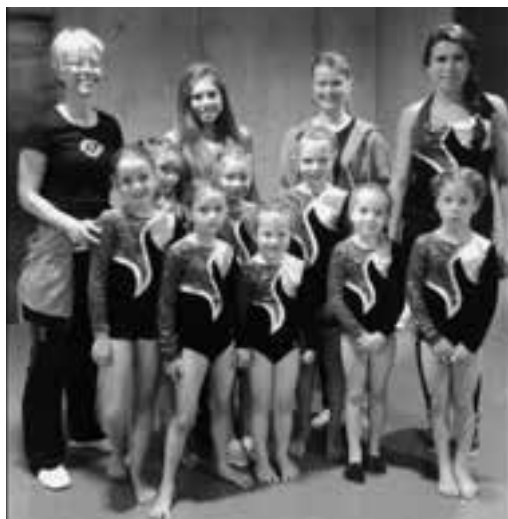
Die Kleinsten und die Grössten der Geräte-riege Effretikon

nung will sie die 8,40 von Andelfingen so schnell wie möglich vergessen. «Gäll im nächsten Training üben wir das Reck?» fragte sie nach der